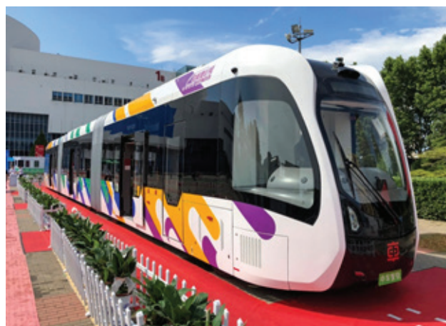
Slika 1. Prvi autonomni voz u Kini [4]

Na sledećoj slici (Slika 1.) prikazan je voz Yibin T2 linije koji ilustruje jednu od najnovijih implementacija autonomnog železničkog saobraćaja u realnim uslovima.