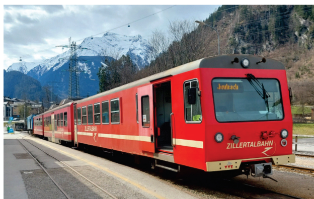
Slika 2. Cilertalov voz sa tri vagona, pokretan dizel lokomotivom © MfV, 240315_1243

Početkom 1980-ih godina, Cilertalban je počeo da kupuje nove dizel-električne vagona. Kupljeno je 7 vagona, i to dva vagona sa kabinom i 5 putničkih vagona koji su pušteni u rad do 1998. godine. Vidi sliku 2.