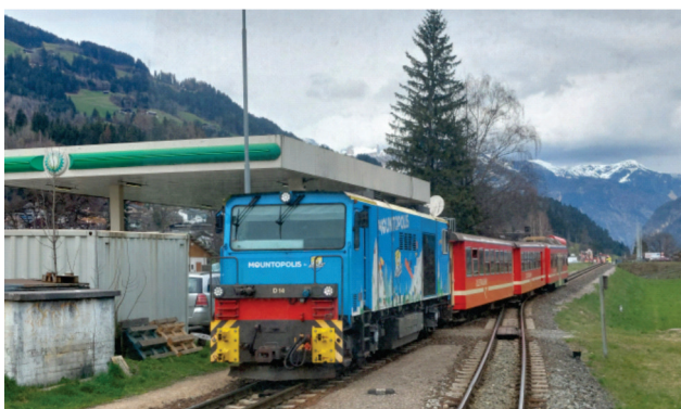
Slika 3. Cilertalov voz sa 3 vagona, pokretan dizel lokomotivom

ne, najstariji vagon je imao 34 godine i zamena je postala hitna. Vidi sl. 3.