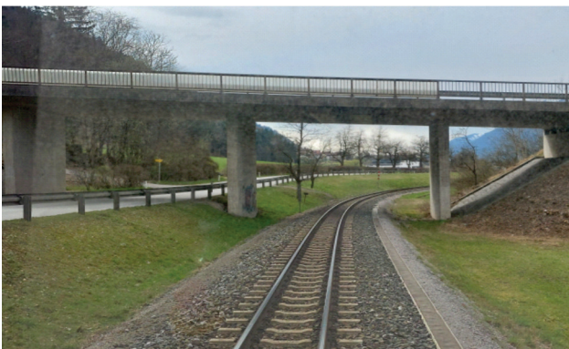
Slika 5. Podvožnjak B169 u km 2+800

Podvožnjak visokonaponskih vodova 220 kV kompanije APG (Austrijska elektroenergetska mreža) između km 30+600 i 30+800, gde najveća visina pod najgorim uslovima nije dovoljna da ispuni zahteve za izolaciju od kontaktne mreže od 15 kV. Ovde se kontaktne mreže može ogoliti, ali mora biti uzemljena.