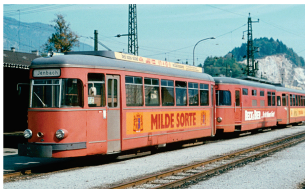
Slika 1. Prvi električni voz u Cilertalu, pokretan dizel generatorskim vagonom 1967, prvobitno je saobraćao u Ravensburgu. Nakon obustave rada tamo, došao je u RTM (Roterdamski tramvajski voz Maatšapij), gde je dodat srednji dizel generatorski vagon da bi radio bez kontaktne mreže. Širina koloseka je promenjena sa 1000 mm na 1067 mm.

Godine 1967, ova kompozicija je stigla u Cilertal i preuređena je na kolosek od 760 mm. Bio je to prvi putnički voz na električni pogon. Bio je u upotrebi do 1997. godine (videti sliku 1).