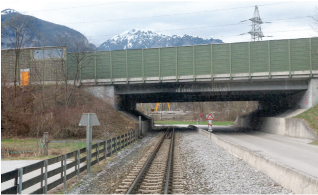
Slika 4. Podvožnjak državnog autoputa A12 na km 1+400