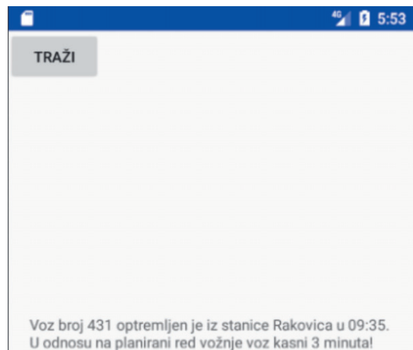
Slika 3. Prikaz dela ekrana mobilne aplikacije koja prikazuje trenutno kašnjenje voza u trenutku otpreme iz poslednje stanice koju je napustio

Kao što je već rečeno, razvijene su dve android aplikacije koje pristupaju istoj MySQL bazi demo_realizacija_reda_voznje koja se nalazi na serveru. Prva aplikacija namenjena je da je koriste otpravnici vozova za unos vremena kada je voz napustio njihovu stanicu. Drugu aplikaciju mogu da koriste putnici kako bi dobili informaciju kada